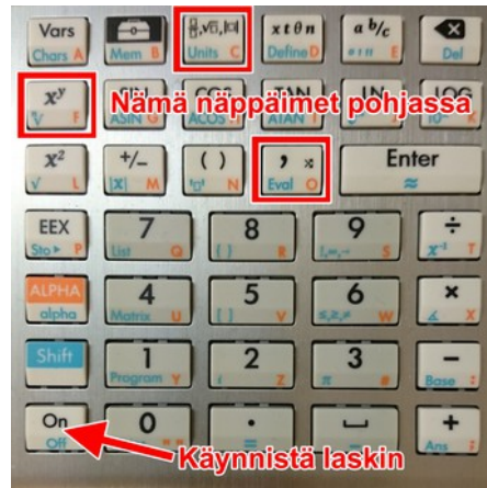
Kuva 1: Käynnistä laskin näppäimet F, C ja O pohjassa.